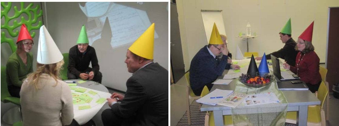
Kuva 1. Työskentelyssä käytettiin kuutta ajatteluhattua.

3D- ja virtuaalimaailmojen suurimmat mahdollisuudet liittyvät kuitenkin siihen, että ne auttavat ylittämään tehokkaasti olemassaolomme rajoitteita. Ne lisäävät todellisuuteemme uusia kerrostumia. Ne jäljittelevät – tai pikemmin luovat – todellisuutta uskottavasti mutta eivät ole siitä millään tavalla riippuvaisia: paitsi että ne toimisivat monipuolisina käytännön apuvälineinä ja niiden avulla periaatteessa minkä tahansa kuvitelman toteuttaminen olisi mahdollista. Tässä mielessä ne toteuttaisivat teknologian perusfunktiota kykyjemme voimistajana aivan uudella tavalla.